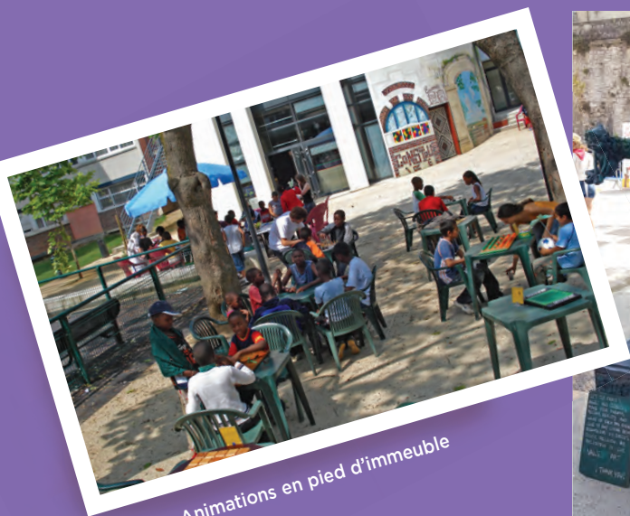
Animations en pied d'immeuble