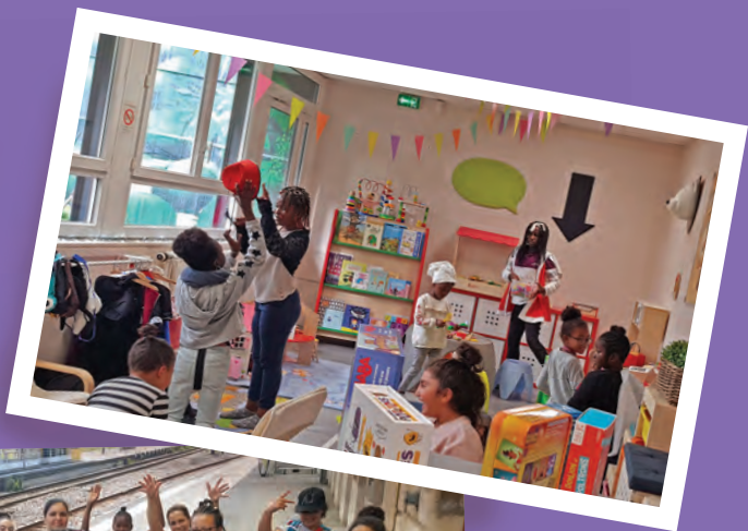
Après-midi jeux à Camille Claudel