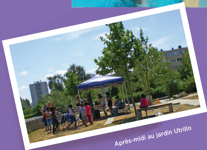
Après-midi au jardin Utrillo