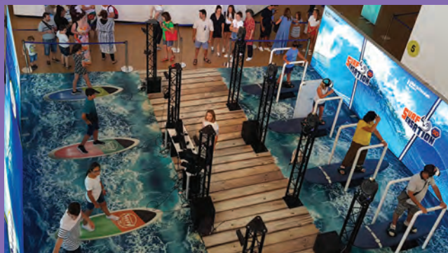
Visite de la Cité de l'Océan