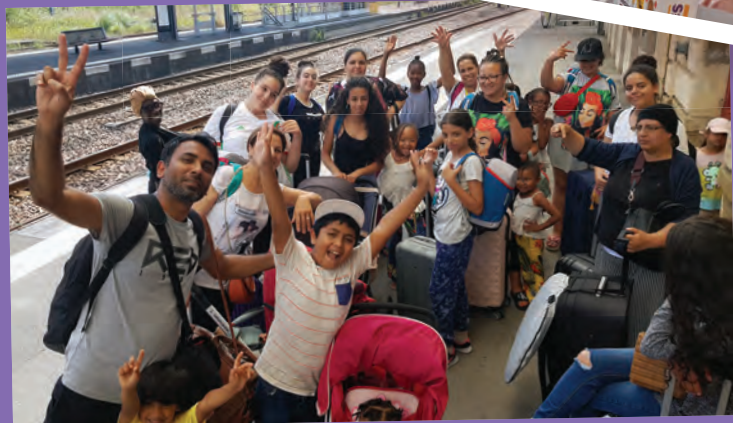
Séjour famille 2019