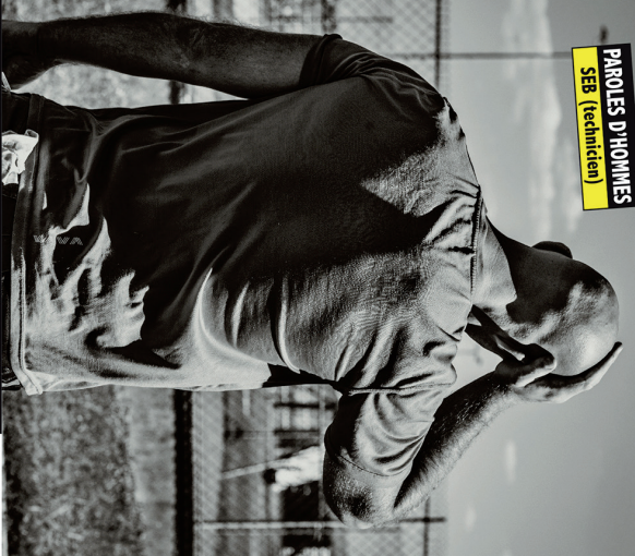
Villiers-le-Bel contre les violences conjugales