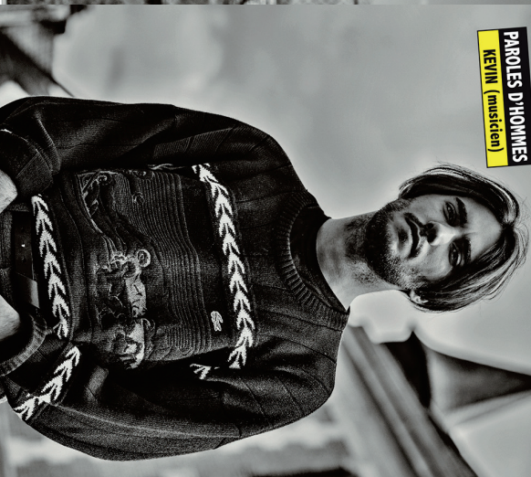
Villiers-le-Bel contre les violences conjugales