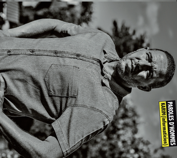
Villiers-le-Bel contre les violences conjugales