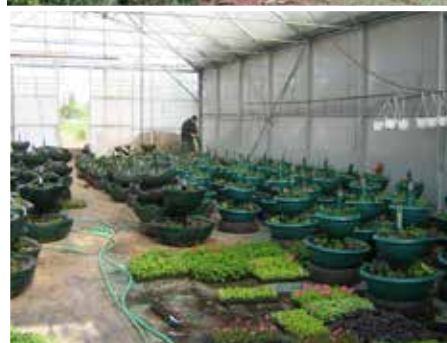
Les agents de la Ville n'utilisent plus aucun produit chimique pour entretenir les espaces verts.