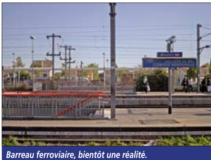
Barreau ferroviaire, bientôt une réalité.