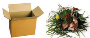
Les métaux, le bois, les cartons Les gravats, les déchets verts