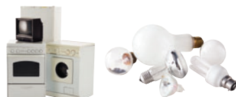
Les déchets d'équipements électriques et électroménagers

Les 3 déchèteries sont fermées le 1 er mai, le 1 er novembre, le 25 décembre et le 1 er janvier.